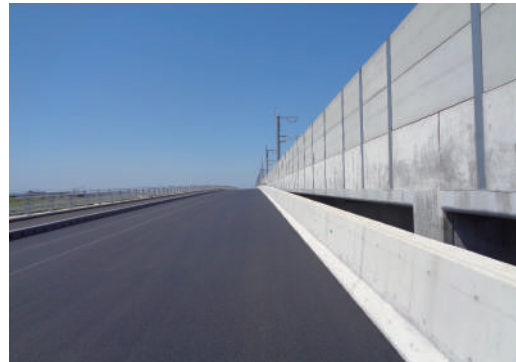
アスファルト舗装後