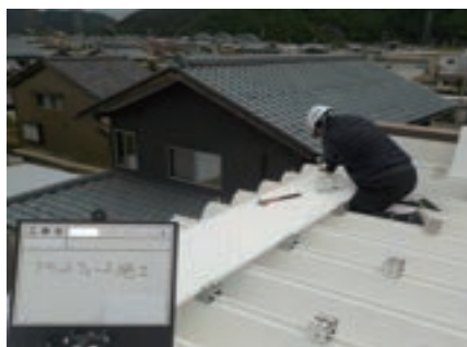
③ベースパネル取付