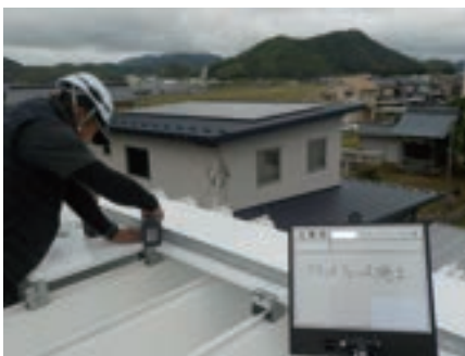
④雪止め金具の設置