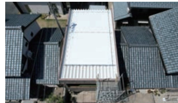
完了後ドローンで撮影