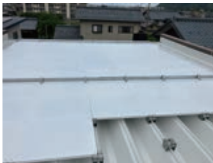
⑤フラットフェース®敷設