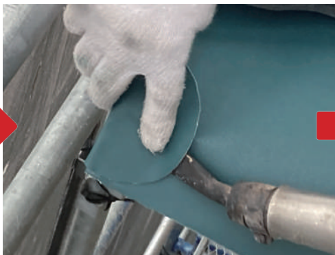
出隅や入隅のコーナパッチ（防水性能強化）