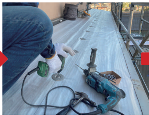
絶縁シート敷設後、IH ディスク（アンカーボルト固定）