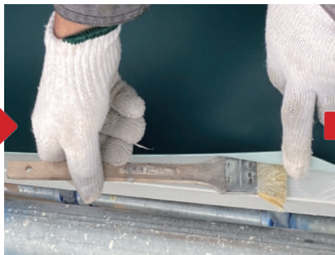
シート末端処理は溶着接合