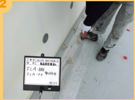
塩ビ鋼板・立ち上り取り付け