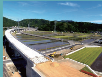
コンクリート床真空脱水圧密工法 ベストフローシステム