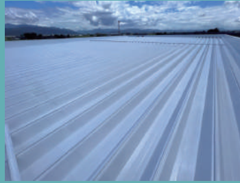
遮熱 & 省エネ工法 シボフェース