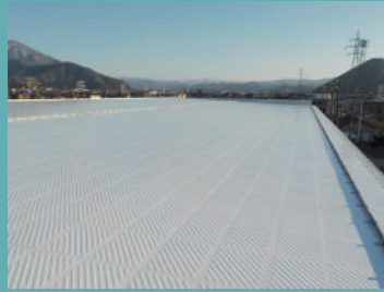
結露防止 & 遮熱等多機能工法 フラットフェース®